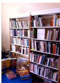
Le fonds professionnel