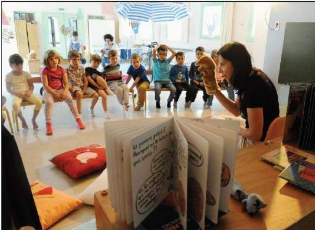
■ Les enfants écoutent l'histoire avec attention.