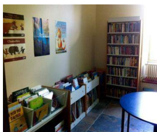
Albums et romans